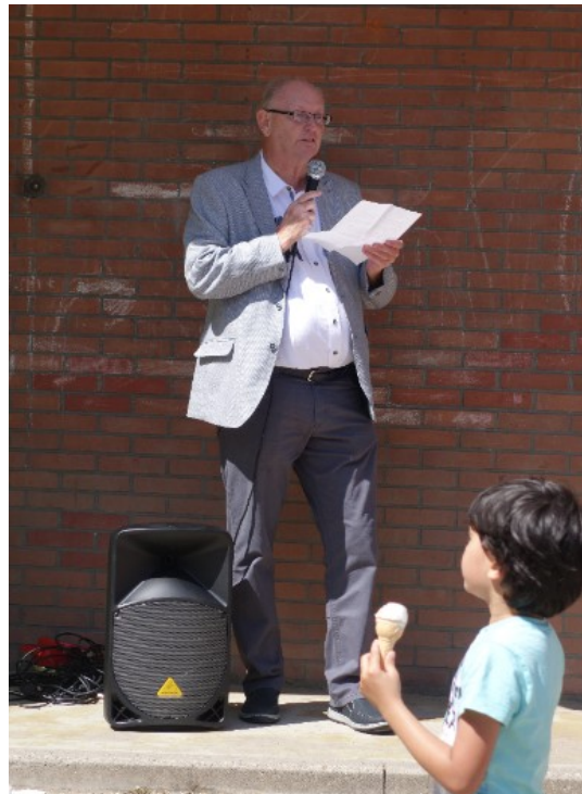
Geen speech, toch een kort bedankje.